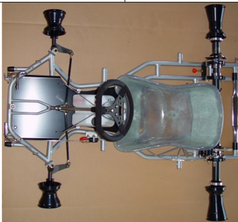
PHOTO VUE DE DESSUS DU CHÂSSIS COMPLET IDENTIQUE À L'UN DES MODÈLES PRÉSENTÉS À L'HOMOLOGATION SANS PARE-CHOCS, CARROSSERIE NI PNEUMATIQUES

This Homologation Form reproduces descriptions, illustrations and dimensions of the chassis frame at the moment of the CIK-FIA homologation. The Manufacturer may modify them, but only within the limits set by the CIK-FIA Regulations in force.